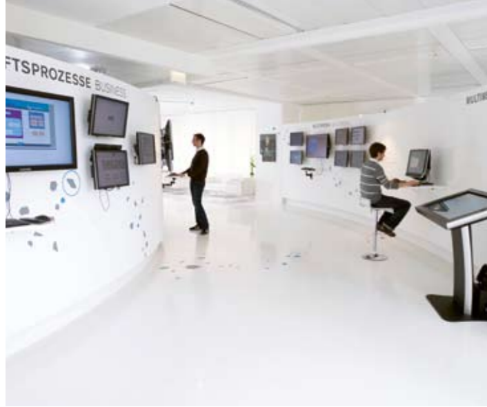
THESEUS – Innovationszentrum Internet der Dienste