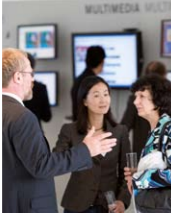
Show Room für Forschungsergebnisse