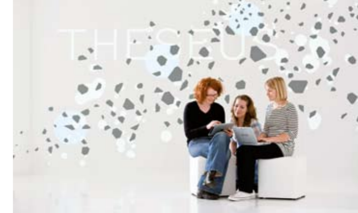
Internet der Dienste erleben, ausprobieren, umsetzen